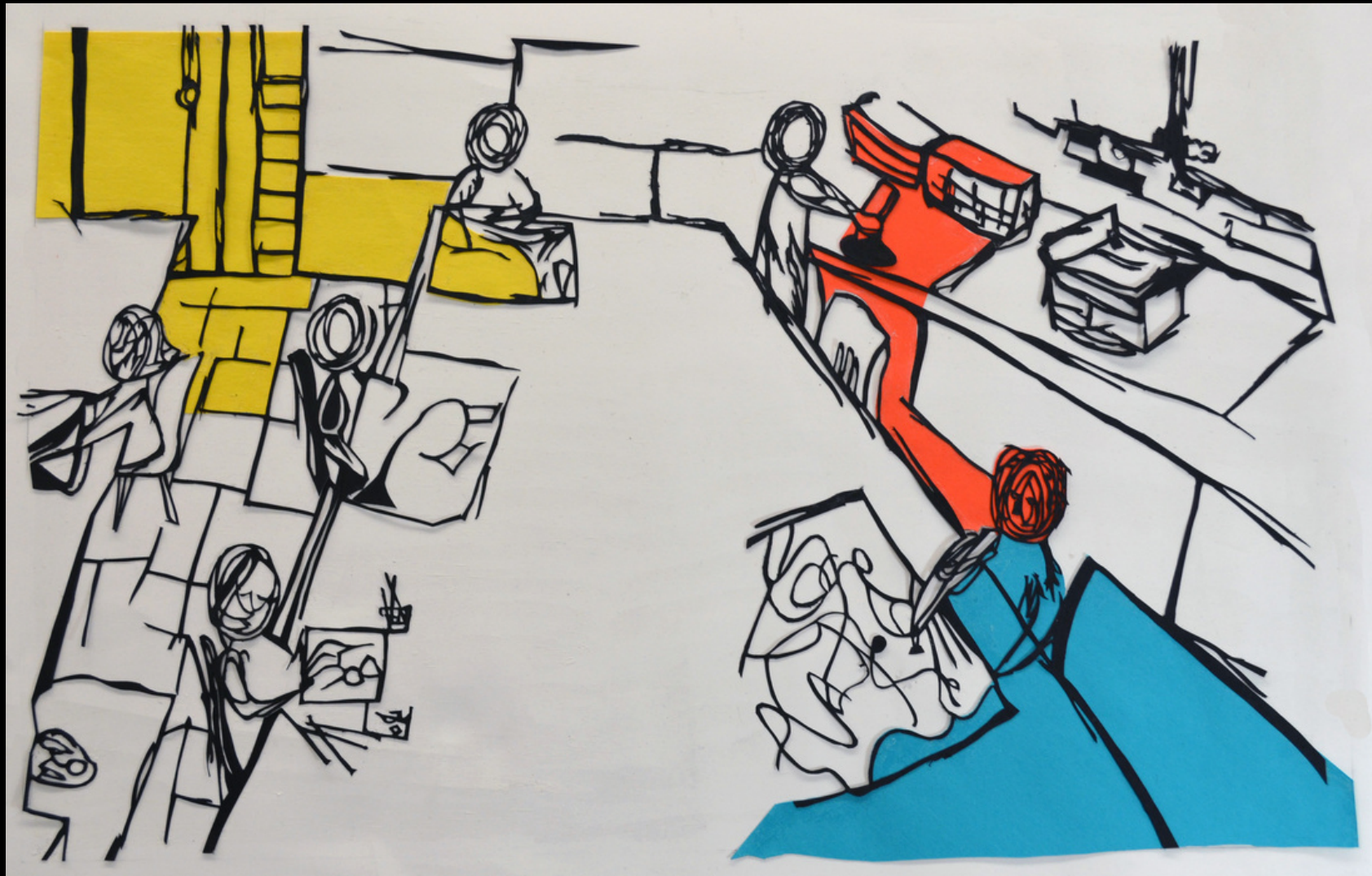
Ying 12 e année