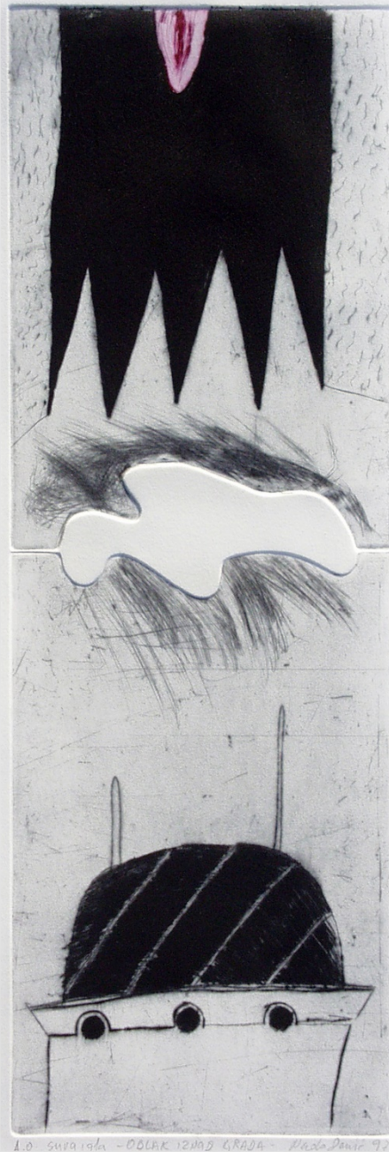
Nada Denic Cloud over the City pointe sèche 1996 27,5 po x 11,5 po

Collection de l'Université de Saint-Boniface