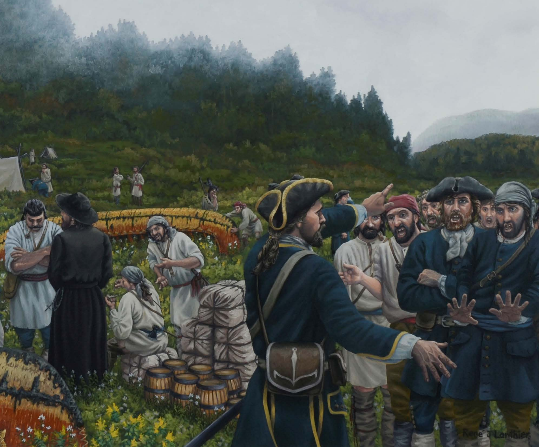
René J. Lanthier Mutiny at Grand Portage huile sur canevas 24 po x 36 po

Collection de l'Université de Saint-Boniface