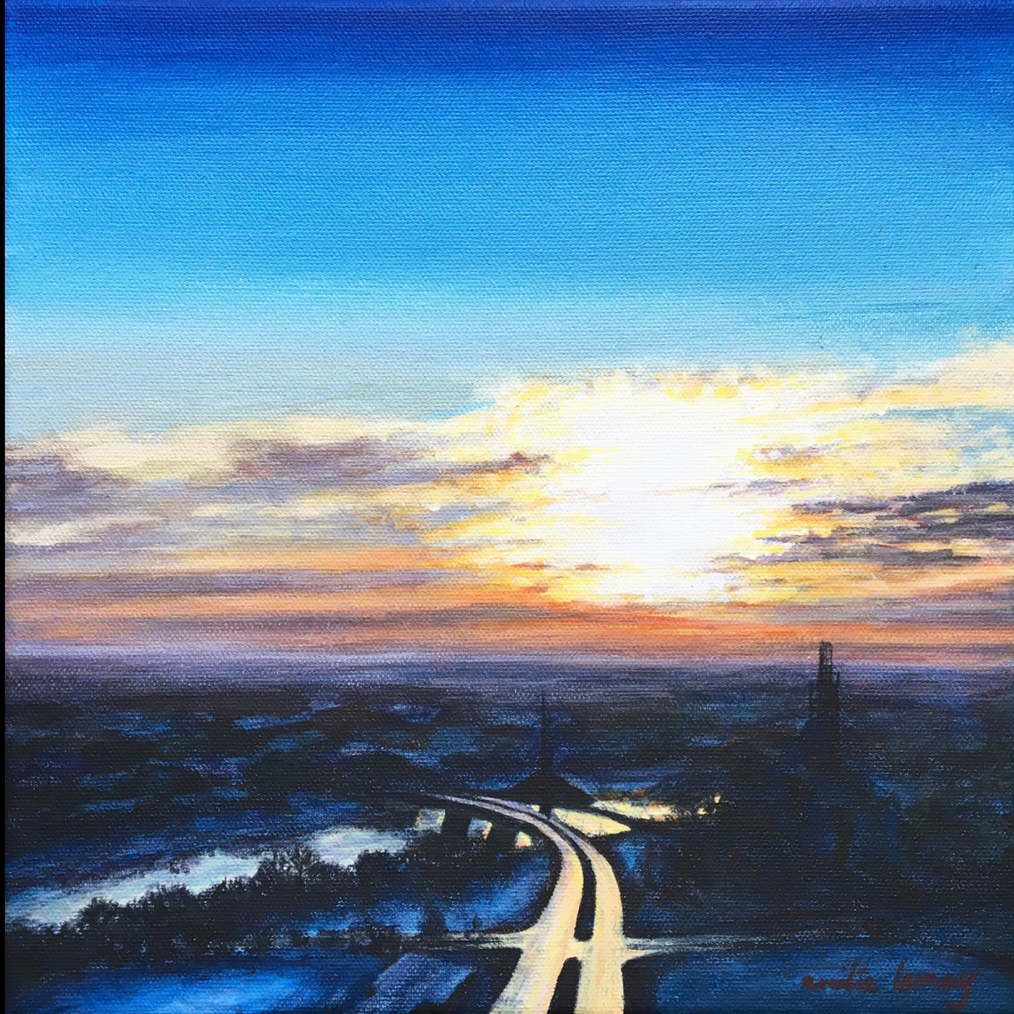
Émilie Lemay Étude de Paysage Saint-Bonifascinant acrylique sur toile 10 po x 10 po 2018