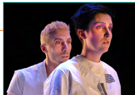
Promenade Santé TCM | THÉÂTRE ( eric-plamondon.com )