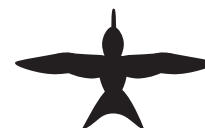
colibri (ou oiseau-mouche)