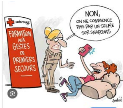
© SOULCIÉ, Thibaut, « Formation secourisme PSC1... - Comité Départemental triathlon Indre et Loire », Iconovox , publié le 15 janvier 2017, (Consulté le 10 septembre 2025).