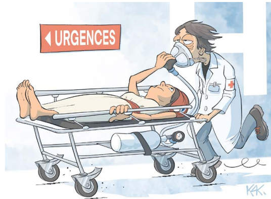
© Monsieur KAK, « Hôpital : les urgences en tension », L'Opinion , publié le 23 novembre, 2021, < https://www.lopinion.fr/de-qui-se-moque-t-on/hopital-les-urgences-en-tension-masque-oxygene > (Consulté le 9 septembre, 2025).