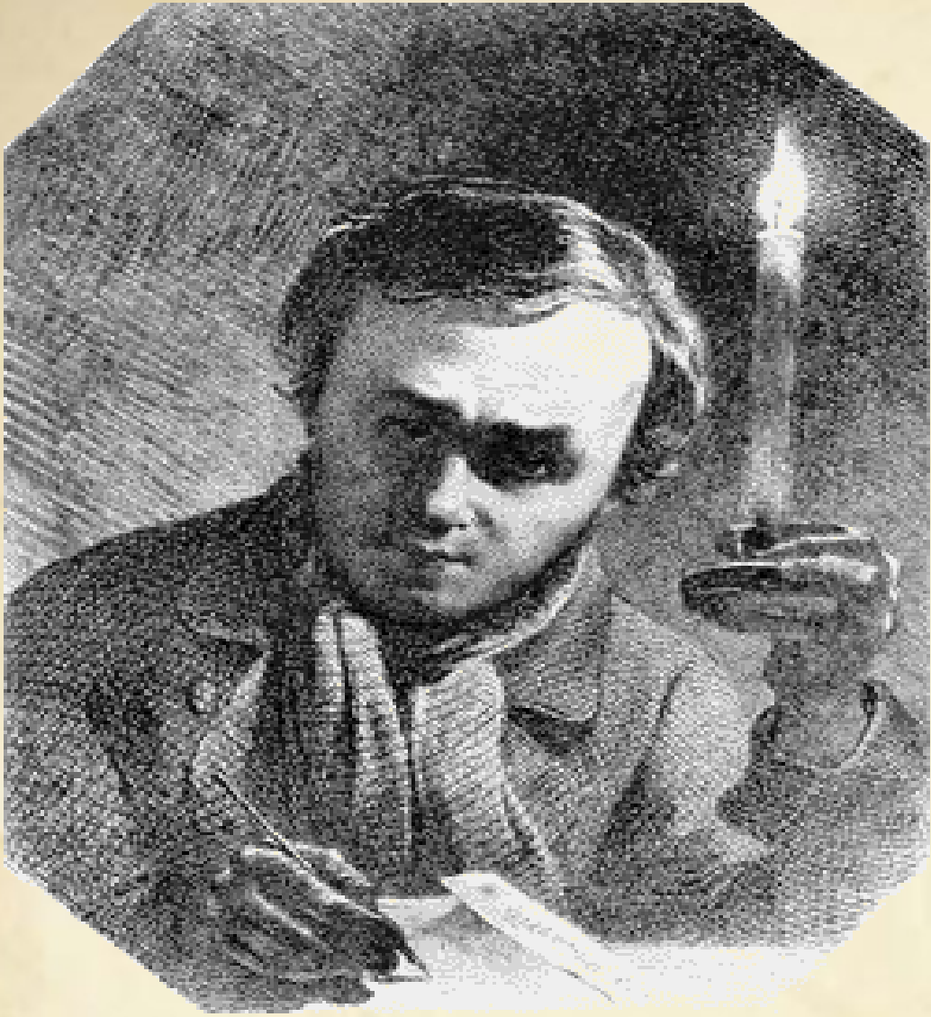
Автопортрет Т. Шевченка зі свічкою

Навесні 1831 року разом з паном, Шевченко потрапив до Петербурга, а згодом був відданий «в науку до майстра живописних справ» Ширяєва. У 1835 році відбулася доленосна зустріч із земляком – художником Іваном Сошенком, який познайомив Тараса з творчою інтелігенцією Петербурга. 22 квітня 1838 року Тараса викуплено з кріпацтва. 1838–1845 роки – навчання в Академії мистецтв.