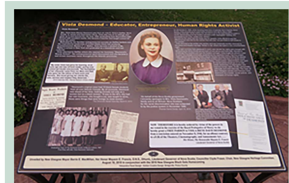
Plaque commémorant Viola Desmond, située à deux pâtés de maisons du Roseland Theatre, à la bibliothèque publique d'Halifax

https://dref.mb.ca/notice?id=p%3A%3Ausmarcdef_0000089906&locale=fr