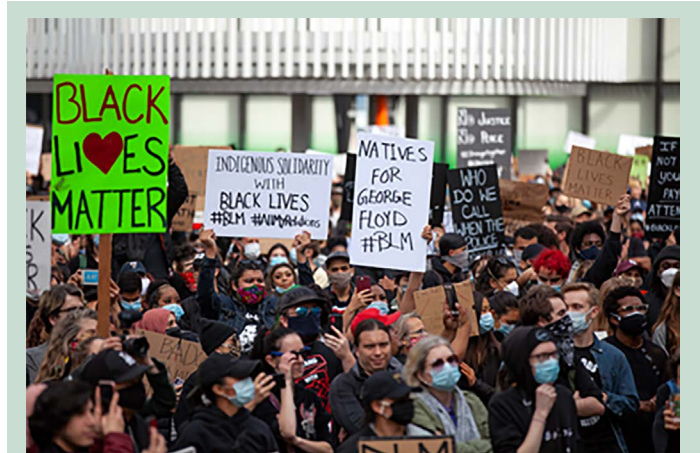
Manifestation Black Lives Matter, Vancouver, 31 mai 2020

Un blogue du Centre de services scolaires de Montréal qui propose multiples ressources pour les enseignants du primaire et du secondaire. On y retrouve une liste de vidéos IDÉLLO, des suggestions de livres et de sites informatiques.