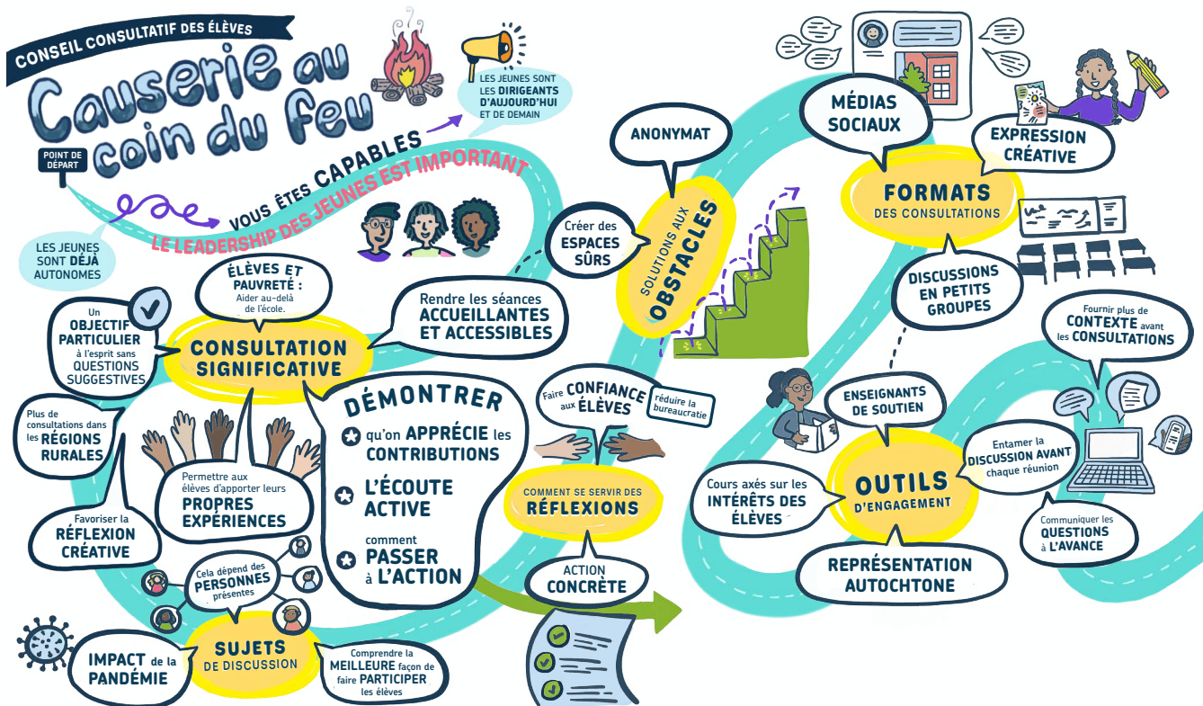
Causerie au coin du feu du Conseil consultatif des élèves | Le 13 février 2023

ENREGISTREMENT GRAPHIQUE EFFECTUÉ EN DIRECT