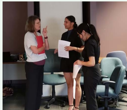
Membres du Conseil consultatif des élèves qui discutent avec la sous-ministre, Dana Rudy, au sujet de sa participation à la rencontre des ministres de l'Éducation du G7 au Japon en mai 2023.