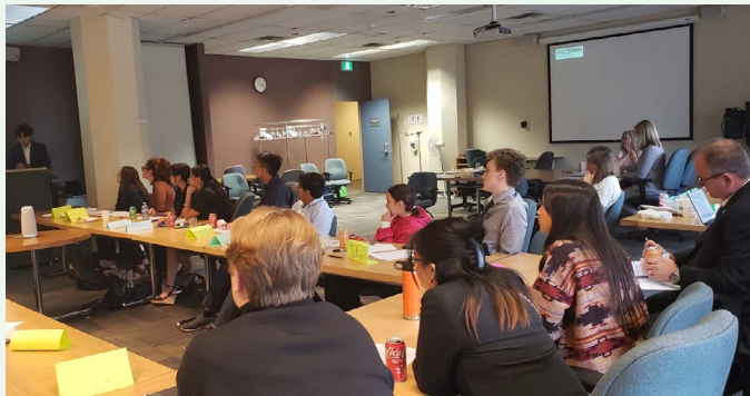
Le Conseil consultatif des élèves présente son rapport au ministre Wayne Ewasko.