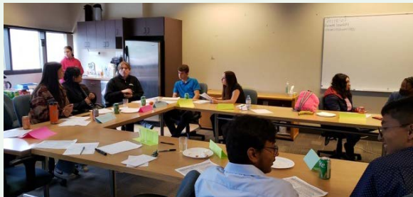
Les membres du Conseil se rassemblent pour discuter des thèmes pertinents au système d'éducation du Manitoba.