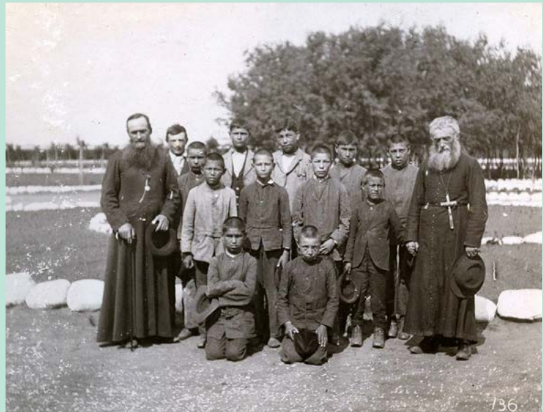
Reproduction de Residential Schools, Culture, and Identity | Provincial Archives of Saskatchewan (saskarchives.com).

Bien que le présent document comprenne bon nombre de ressources pour faciliter l'apprentissage à ce sujet, il est à noter que plusieurs de ces ressources ne sont offertes qu'en anglais.