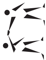
Tableau synoptique du résultat d'apprentissage général n° 4 — Gestion personnelle et relations humaines