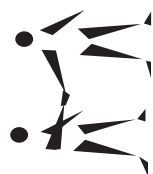
Tableau synthèse de Gestion personnelle et relations humaines

L'élève doit être capable de se connaître lui-même, de prendre des décisions favorables à sa santé, de coopérer avec les autres en toute équité et de bâtir des relations positives avec eux.