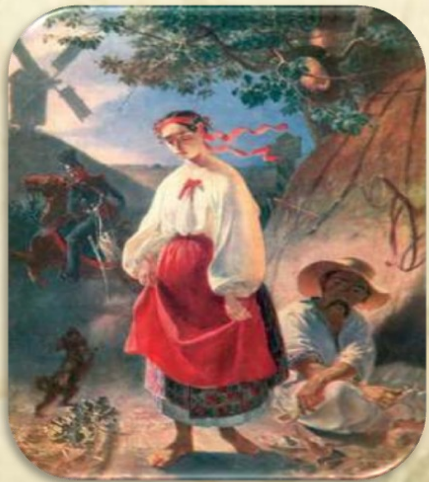
Одна з перших робіт Тараса Шевченка «Катерина»