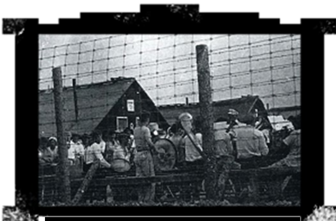
The Huns Band, Kapuskasing

Останній канадійський концтабір перестав існувати 24 лютого 1920 року.