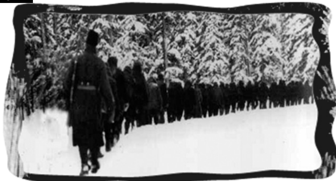
Leaving Cave and Basin Camp