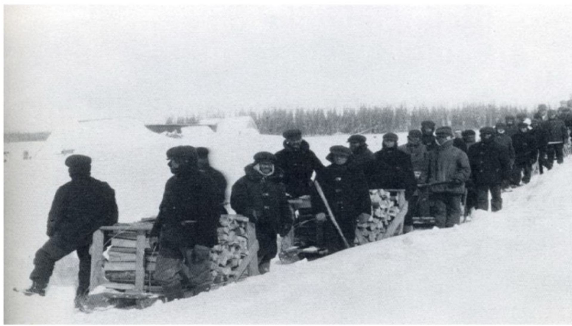
Wood cutters at Spirit Lake internment camp, Quebec

Інтерновані українці протестували проти обставин. У концтаборі Капускасіну в 1916 році відбувся бунт, який охопив близько 1200 в'язнів та 300 охоронців.