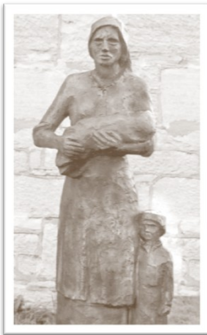
"Interned Madonna" memorial, Spirit Lake, Quebec

Уряд Канади виділив 2,5 млн. доларів на фінансування пам'ятних заходів та освітніх програм, пов'язаних з інтернуванням канадійських українців.