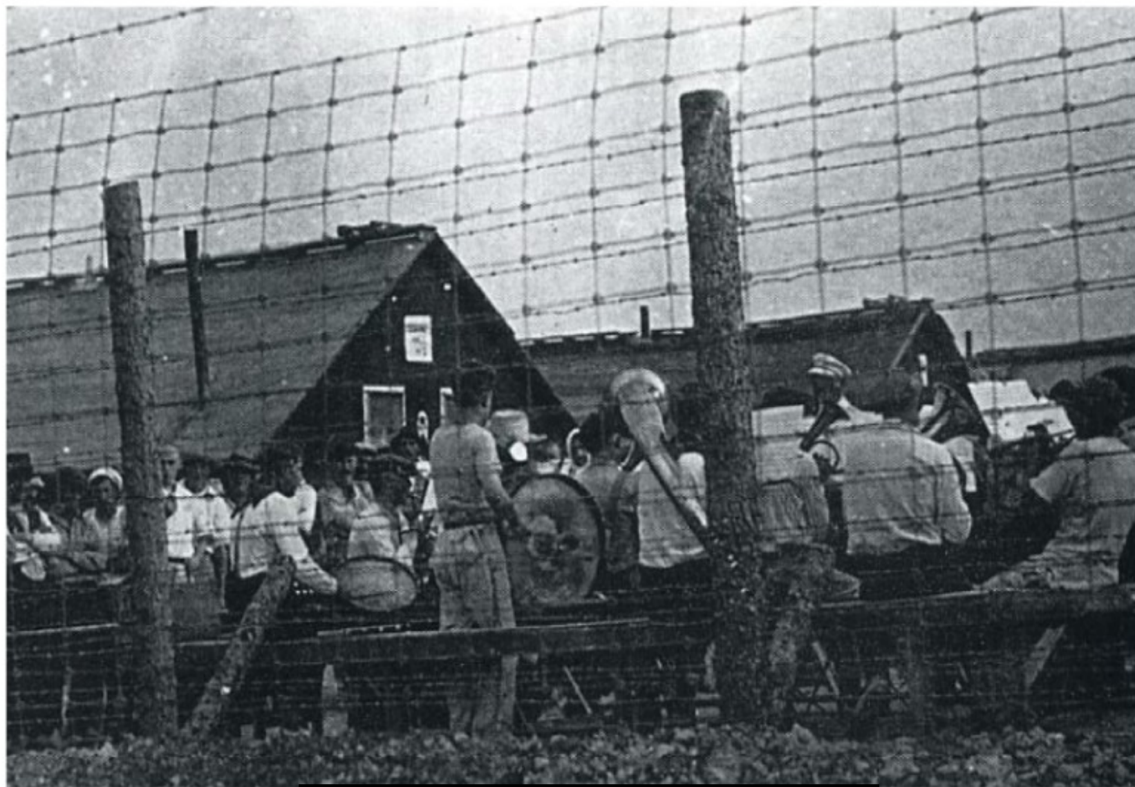
The Huns Band, Kapuskasing

Під час прешої світової війни (1914-1920) українців, які приїхали з частини України, яка перебувала у складі Австро-Угорщини було інтерновано, тобто насильно затримано у 24-х трудових таборах Канади і таборах для інтернованих.