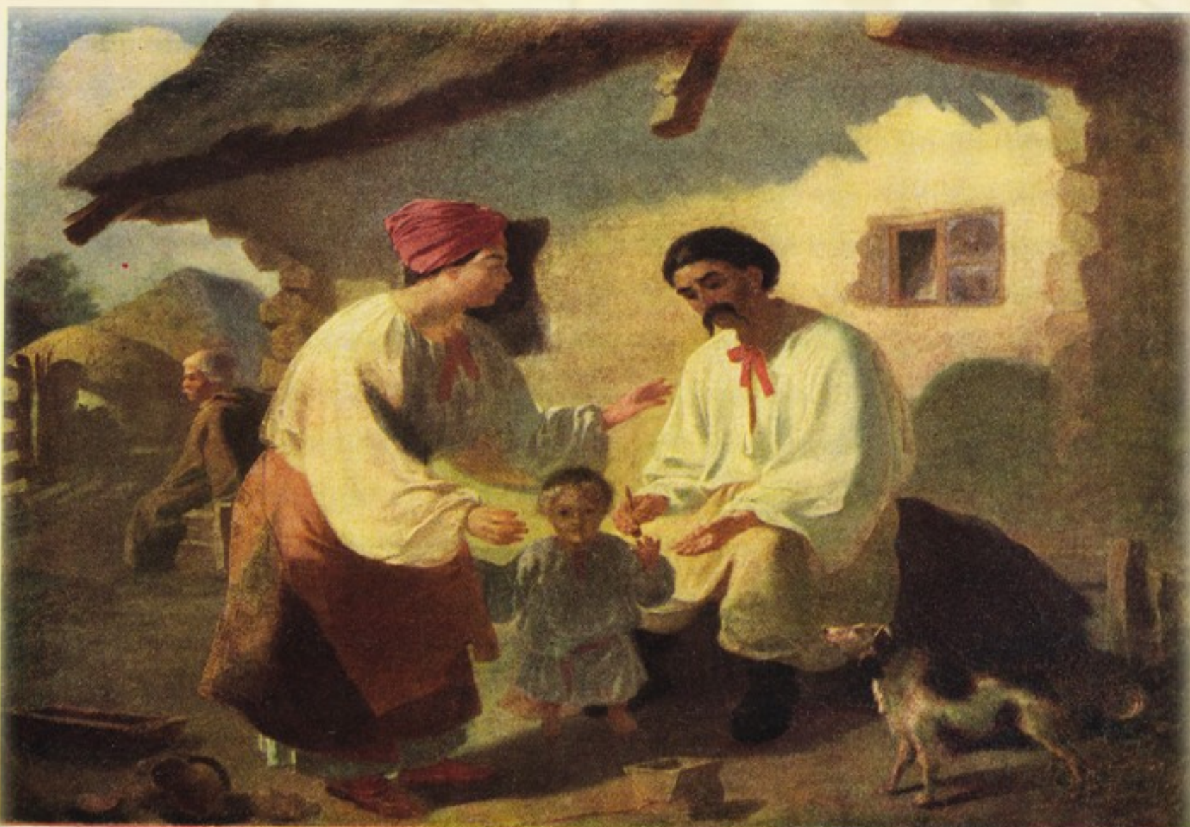
75. СЕЛЯНСЬКА РОДИНА. Олів. III, р. К. 1843.

Тарас Шевченко з дитинства любив малювати. Його малюнки і гравюри відомі по цілому світу. Їх можна побачити в найкращих музеях як в Україні, так і за її межами. Завдяки своєму таланту Тарас Шевченко став вільною людиною. Саме в дитинстві, з малювання почався його творчий шлях як геніального художника, поета і творця.